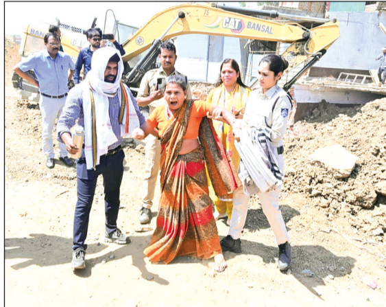
विदिशा। विदिशा हाईवे बायपास पर अतिक्रमण हटाने पहुंचा अमला। दूसरे फोटो में शमशाबाद में वनभूमि से अतिक्रमण हटाते हुए वनअमला।

नेशनल हाईवे द्वारा भोपाल सागर हाईवे के चौड़ीकरण का कार्य किया जा रहा है। इसी के तहत शर्मापुर क्षेत्र में सड़क चौड़ीकरण के साथ जल निकासी के लिए नाली निर्माण की योजना है। कार्रवाई के दौरान प्रशासन की टीम मौके पर पहुंची और हाईवे किनारे बने कुछ निर्माणों को हटाने की कार्रवाई शुरू की। बताया जा रहा है कि इस क्षेत्र में पहले से बने कुछ निर्माण कार्य हाईवे की जमीन में आ रहे थे। जिनके लिए एनएचआई द्वारा संबंधित लोगों को मुआवजा भी दिया गया था। स्थानीय लोगों का कहना है कि जितनी जमीन का मुआवजा मिला था, उतने हिस्से में